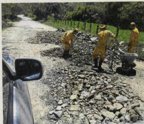
Cerca de 3.200 empleos directos anuales se generarían durante la etapa de construcción. El Sena viene adelantando proceso de vinculación.

"Al garantizarse la financiación del proyecto todo está dado para que las obras en pleno comiencen el 29 de agosto de este año, ya que esta concesionaria firmó el acta de inicio el 28 de agosto de 2015 y como estaba previsto ya casi completa el año de pre-construcción que tenía, luego del